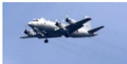
14時49分 海上自衛隊 EP-3 電子戦データ収集機です。