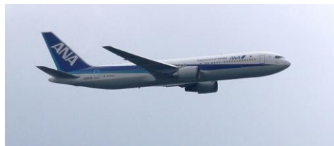
14時50分 全日空旅客機定期便