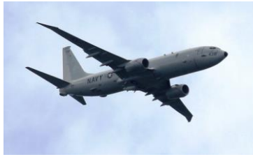
12時31分オライオン 438番