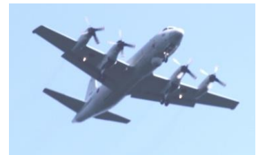
14時39分 海上自衛隊 -3C.画像収集機。基地のそ ばで飛んでいるのを毎日み ているが、その殆どが文珠 山上空から戻るのでしょうか。