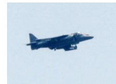
11時56分 米海兵隊 AV-8B ハリアーII。小さいがホーネ ット以上にうるさく速い。こ のあたりの皆さん大変でしょう