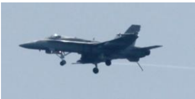
11時30分 米海兵隊 FA-18 文珠山頂上の北側上空。