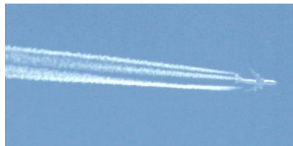
11時39分かなり上空に飛行機 雲を作りながら飛ぶ機も。ホー ネット。文珠山北側上空。