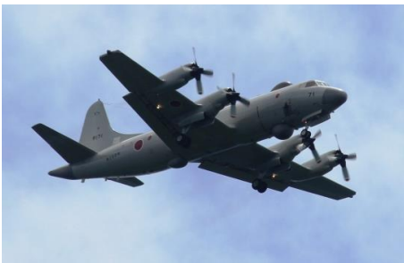
13時24分 海上自衛隊機 EP-3 電子データ収集機。