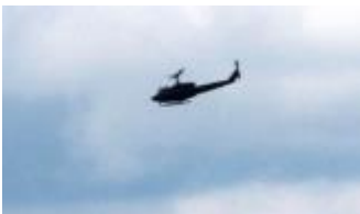
14時38分陸上自衛隊機 UH-60JA 多用途ヘリ。