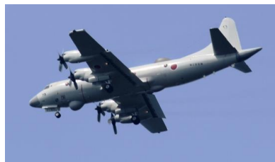
14時00 昼休みがおわると 再開。海上自衛隊 EP-3 電子 データ収集機。文珠山展望台 のすぐ上で向きをかえて基地へ。