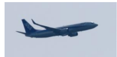
14時55分 全日空旅客定期便