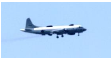
12時22分 海上自衛隊 UP-3 ハリアー、ホーネット、プラウ アーを聞きなれていると、音が かなり小さく、米軍機は嫌だが、 自衛隊はいいという人の気持ちも わかるような気がする。