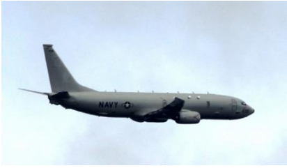
12時19分米海軍 P3-C オライオン